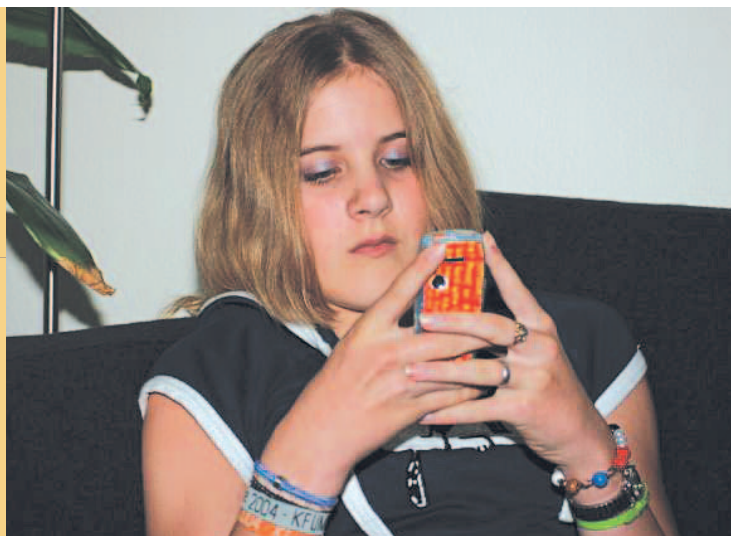
Mobiltelefonen er mange unges vigtigste kommunikationsmiddel.

Familienormerne skal skabes i den enkelte familie. Forældre skal beslutte, hvor deres grænse går for, hvor meget og hvordan de kan acceptere børns mobilbrug i hjemmet.