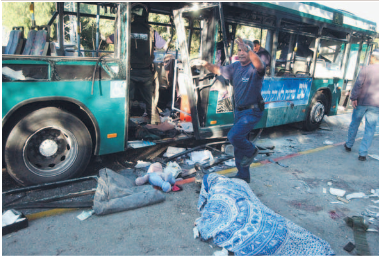
den 21.11.2002. Israelsk politi er på arbejde efter et selvmordsbombeangreb i Jerusalem. 11 mennesker blev dræbt og over 40 sårede.

trække en grænse. Her tænkes der på medierne, både de skrevne og de elektroniske. Der sker voldsomme begivenheder i verden, og det er nyhedsudsendelsernes opgave at berette om dem. Dog sker der ofte efter min mening en overskridelse af de etiske grænser, når det drejer sig om billedsiden. De triste og alvorlige selvmordsangreb, som sker bl. a. i Israel, hvor mennesker lemlæstes og dræbes, skal refereres, men jeg finder grænsen overskredet, når der gentagne gange skal vises billeder, hvor blodet flyder ned ad ofrene. I foråret så vi et terrorangreb i Madrid, hvor et tog blev sprængt i luften, og vi så billeder af ødelagte togvogne, men det var ikke nødvendigt at vise billeder af døde mennesker spredt ud over terrænet eller en afrevet legemsdel liggende på en mur.